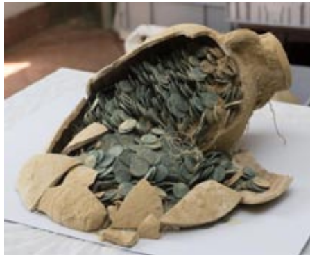
Una de las ánforas de aceite halladas en Tomares.

Hay que indicar que poco después, hacia el siglo V, este comercio de aceite parece reactivarse tímidamente en Andalucía. Uno de los pocos emprendedores supervivientes de la Bética tenía su fábrica en la periferia de Ochavillo del Río, sobre el cuál hablaremos en otra ocasión.